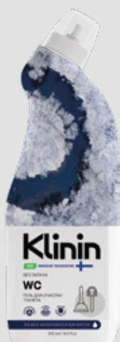
WC для очистки туалетов