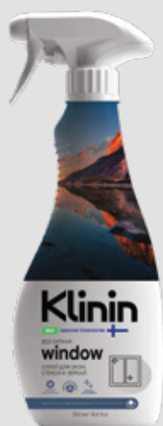
window для окон, стекел и зеркал