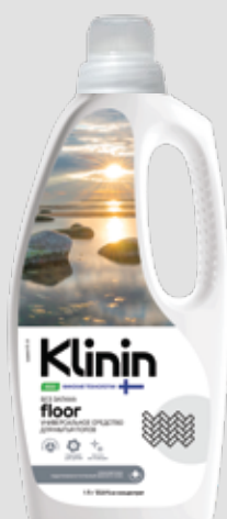
floor средство для мытья пола универсальное