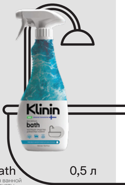
bath для ванной комнаты