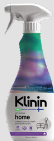
home для всех моющихся поверхностей в доме